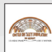
Centre des arts populaires