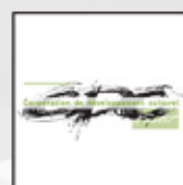
Corporation de dév. culturel de Nicolet