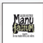
Galerie-boutique Manu factum