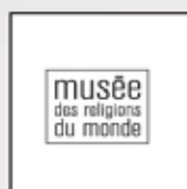
Musée des religions du monde